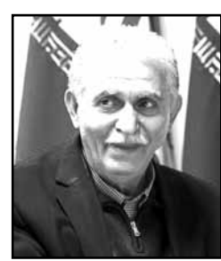
مشاور عالی سازمان سنجش آموزش کشور