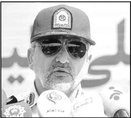
توسعه مشارکت‌های مردمی و غیره هستیم.

رییس پلیس امنیت کشور با تأکید بر اینکه امروز برای امنیت چاره‌ای جز بسیج شدن همه کشورها و ایجاد امنیت جهانی وجود ندارد، اظهار کرد: تزویر و دورویی آثار بلندمدتی برای کشورها دارد و حتی کشورهایی که ممکن است حمایت از تروریست‌ها منافی برایشان داشته باشد، در بلندمدت باید هزینه‌های گزافی بپردازند همانطور که دیده شد بمباران تروریست‌ها در عراق نه تنها مانع‌شان نشد بلکه آنان به پیش‌روی‌شان نیز ادامه دادند بنابراین باید در حوزه امنیت صادقانه کار کنیم و از شهروندانمان حمایت کنیم.