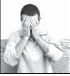
رئیس پلیس آگاهی فرماندهی انتظامی غرب استان تهران از کشف تسهیلات غیرمجاز بانکی میلیاردی با جعل پروانه بهره برداری گاوآردی خبر داد.

عمل آمده متهم ردیف دوم نیز در خارج از کشور حضور داشته که با به دست آوردن شماره همراه وی سه همسر نامبرده نیز شناسایی و در ادامه دو آدرس از وی یکی در تهران و دیگری در کرج شناسایی شد که نامبرده با خودرو های اجاره ای هیوندا