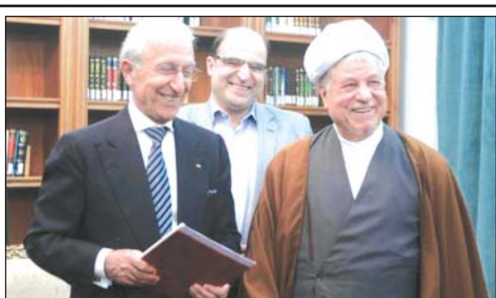
پروفسور سمیعی در دیدار با رئیس مجمع تشخیص مصلحت نظام: