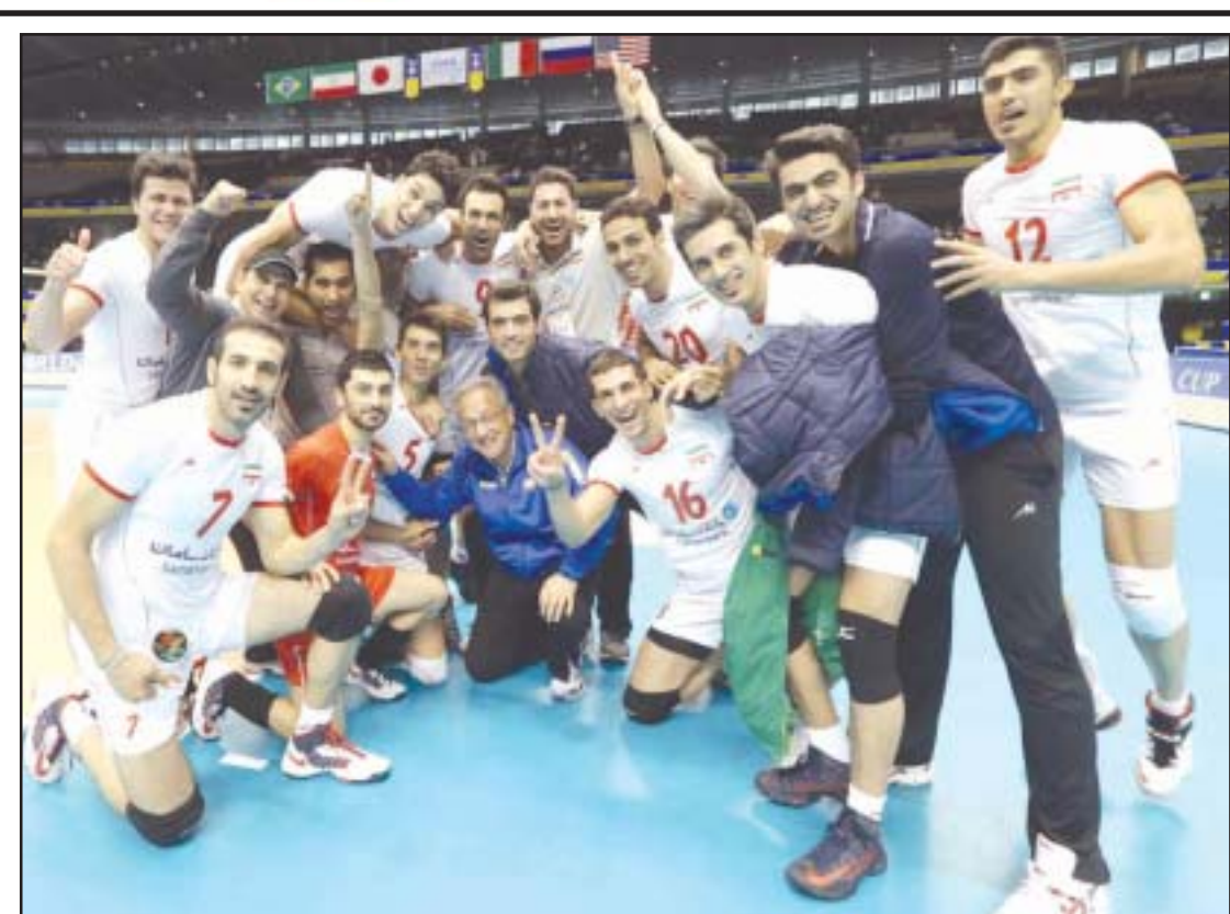
پیروزی شگفت انگیز والیبالیست های ایران بر تیم ملی آمریکا در مسابقات قهرمانی قاره های جهان صفحه ۸

✓ بیشترین معافیت های پزشکی متعلق به تهرانی ها! ✓ خبر خوشی رئیس پلیس کشور به سربازان ✓ نظر فرمانده نیروی انتظامی درباره سربازی معنادان صفحه ۱۱