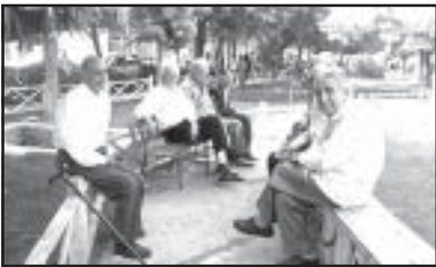
رییس کانون عالی بازنشستگان و مستمری بگیران سازمان تامین اجتماعی،

اجرای بیمه تکمیلی بازنشستگان تامین اجتماعی از آذر