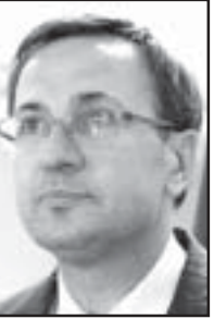
معاون وزیر راه

در راستای اجرای برنامه‌های سازمان راهداری و حمل و نقل روستایی برای توسعه و نوسازی ناوگان حمل و نقل عمومی روستایی، تسهیلات وام ۱۵ میلیون تومانی به متقاضیان پرداخت می‌شود. به گزارش ایسنا، شهربار آفندی‌زاده - معاون وزیر راه و شهرسازی - گفت: منابع مالی این تسهیلات از طریق انعقاد تفاهم‌نامه فی‌مابین صندوق مهر امام رضا (ع) و مرکز توسعه روستایی و مناطق محروم کشور و این سازمان، تأمین اعتبار شده که در سال جاری برای نوسازی هزار دستگاه سواری به متقاضیان پرداخت می‌شود. وی با تأکید بر اینکه توسعه ناوگان حمل و نقل عمومی روستایی و ایجاد دفاتر حمل و نقل روستایی یکی از عوامل مؤثر در ایجاد فرصت‌های شغلی روستائیان به شمار می‌رود، افزود: یکی دیگر از اقدامات این سازمان، انعقاد تفاهم‌نامه همکاری با کمیته امداد امام خمینی (ره) و سازمان بهزیستی کشور با موضوع اعطای ۳۵۰۰ فقره تسهیلات طرح خوداشتغالی با کارمزد چهار درصد برای هر خودرو در سال جاری است که تاکنون ۷۰۰ متقاضی به شرکت ایران خودرو معرفی شده‌اند. رئیس سازمان راهداری و حمل و نقل جاده‌ای گفت: در زمینه واگذاری ۵۰۰ دستگاه خودروی ون غزال به متقاضیان فعالیت در بخش حمل و نقل روستایی از طریق معرفی به صندوق مهر امام رضا (ع) تاکنون ۶۱ فقره تسهیلات به متقاضیان پرداخت شده است.