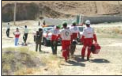
گفت: محور نجف‌آباد - اصفهان در منطقه مسجدحضرت ابوالفضل به عنوان پرحادثه‌ترین محور

در حوادث جاده‌ای شناخته شده و پس از آن کرج - چالوس، شاهین‌شهر به نجف‌آباد نیز پرحادثه‌ترین محورهای کشور لقب گرفته‌اند.