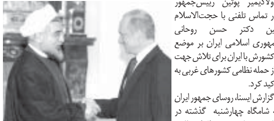
ولادیمیر پوتین رئیس‌جمهور