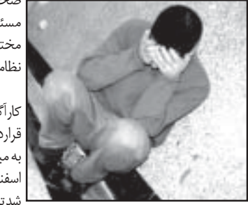
مردی که با اجاره ساعتی یک واحد

تجاری اقدام به‌درج آگهی در نیازمندی‌های روزنامه و کلاهبرداری کرده بود، دستگیر شد.