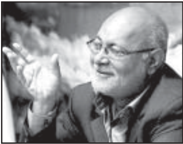
عضو هیات مدیره سازمان تامین

اجتماعی ضمن تشریح نحوه پذیرش بیماران در مراکز پذیرش و ارجاع بیمار” ، مراکز یاد شده را مختص آن دسته از بیمارانی دانست که برای مداوا به مراکز ملکی تامین اجتماعی مراجعه می کنند، اما پذیرش نمی شوند.