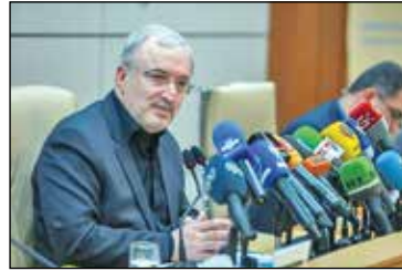
برداشته شده است. وی با اشاره به ریشه کنی فلج اطفال در کشور ادامه داد: طی ماه‌های گذشته گواهی حذف سرخک در کشور نیز صادر شد.

امسال پرونده سلامت ۸۰ میلیون جمعیت به سرانجام خواهد رسید