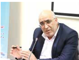
با مالیات بر سکه کرده اند.

به گفته پارسا، در حالی که در همه کشورهای دنیا اداره امور کشور با مالیات مردم انجام می شود، در کشور ما ۳۷ درصد بودجه دولت از طریق مالیات و کمتر از ۵۰ درصد هزینه جاری دولت از مالیات تأمین می شود. در کشورهای پیشرفته ۲۵ درصد کل درآمد مردم به عنوان مالیات به دولت پرداخت می شود اما این رقم در ایران ۸،۵ درصد درآمد مردم است که با این عدد نسبتاً پایین، بسیاری از کارهای عمرانی و اجرایی دولت نیمه تمام می ماند. رئیس سازمان امور مالیاتی با بیان اینکه یکی از مشکلات مالیاتی، فرارهای مالیاتی بزرگ است، افزود: معضل دیگر معوقات مالیاتی بالاست و برنامه های زیادی در سازمان امور مالیاتی برای کاهش فرار مالیاتی و کاهش معوقات شروع کردیم که مالیات به صورت عادلانه و سالم دریافت کنیم و مانند همه کشورهای دنیا، سازمان مالیاتی باید ریز داده ها و تراکنش های مالی و املاک را در اختیار داشته باشد. وی گفت: فرار مالیاتی حتی در بخش دولتی و بخش های عمومی غیردولتی نیز وجود دارد و کسانی که برای فرارهای مالیاتی بزرگ سفارش و توصیه می کنند، در واقع برای فرار از قانون و حق مردم اقدام می کنند و سازمان امور مالیاتی با قدرت وصول مالیات را دنبال می کند و به جای تشخیص علی الراس می خواهد تشخیص مبتنی بر اطلاعات درست را انجام دهد و مدرن سازی سامانه جامع مالیاتی و اطلاعات مالی را برای دریافت مالیات عادلانه و متناسب با ثروت و درآمد و مصرف مردم پیگیری می کند.