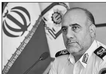
شهروندان جز مواردی است که پلیس به جدیت آن را انجام خواهد داد.