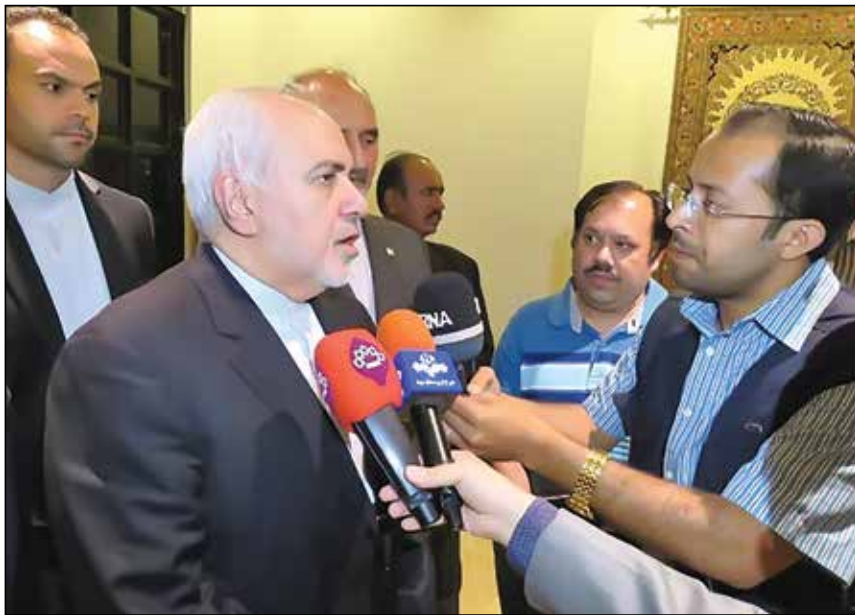
محمدجواد ظریف وزیر امور خارجه در پاکستان:

یکشنبه ۵ خرداد ۱۳۹۸ - دور جدید شماره ۸۰ - (شماره پیاپی ۷۸۶) - ۸ صفحه - ۱۰۰۰ تومان