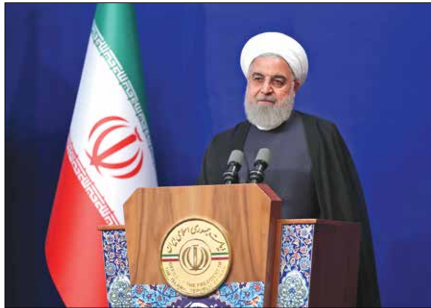
رئیس‌جمهور در کنگره ملی تجلیل از ایثارگران: