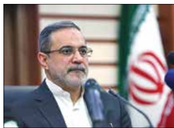
تا کسانی که شکایت دارند از این طریق شکایاتشان را ارسال کنند

هشدار نسبت به ارائه کارنامه در قبال «پول»