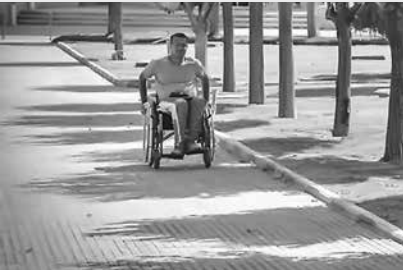
تومان را می‌دهیم.

معاون امور توانبخشی سازمان بهزیستی کشور گفت: بنابراین هنوز مشخص نیست که چه زمانی افزایش پرداختی‌ها اجرایی می‌شود اما با شروع پرداختی‌ها مانند سنوات گذشته این مبلغ به همراه مابه‌التفاوت به حساب مددجویان واریز می‌شود.