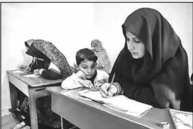
است که مردم باید خودشان این تقاضا را داشته باشند.

باقرزاده با اشاره به تمهیدات وزارت آموزش و پرورش برای ارایه خدمات آموزشی حتی به دورافتاده ترین نقاط کشور، ادامه داد: در سال تحصیلی جاری حدود ۲۰۰ مدرسه کشور تنها با یک دانش آموز فعال است که این در دنیا بی نظیر است.