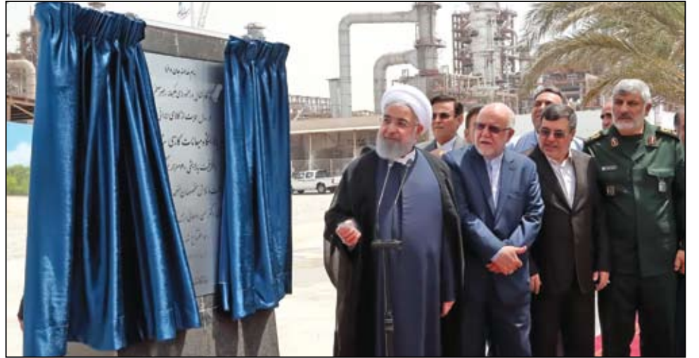
رئیس جمهور در مراسم افتتاح فاز دوم پالایشگاه ستاره خلیج فارس؛