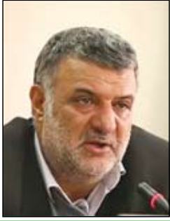
وزیر جهاد کشاورزی هشدار داد