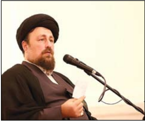
سیدحسن خمینی در مراسم بزرگداشت شهدای هفتم تیر؛

یکشنبه ۱۰ تیر ۱۳۹۷ - دور جدید شماره ۵۵ - (شماره پیاپی ۷۶۱) - ۸ صفحه - ۱۰۰۰ تومان