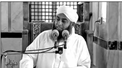
اعزام تیم پزشکی قانونی به ایرانشهر