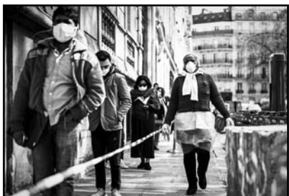
داشته‌اند تا لحظه انتشار این خبر به ترتیب به شرح زیر است: ۱. ایالات متحده ۹۲۵ هزار و ۳۲۲ مبتلا، ۵۲ هزار و ۱۹۳ قربانی ۲. اسپانیا ۲۱۹ هزار و ۷۶۴ مبتلا، ۲۲ هزار و ۵۲۴ قربانی

۳. ایتالیا ۱۹۲ هزار و ۹۹۴ مبتلا، ۲۵ هزار و ۹۶۹ قربانی ۴. فرانسه ۱۵۹ هزار و ۸۲۸ مبتلا، ۲۲ هزار و ۲۴۵ قربانی ۵. آلمان ۱۵۴ هزار و ۹۹۹ مبتلا، ۵۷۶۰ قربانی ۶. انگلیس ۱۴۳ هزار و ۴۶۴ مبتلا، ۱۹ هزار و ۵۰۶ قربانی ۷. ترکیه ۱۰۴ هزار و ۹۱۲ مبتلا، ۲۶۰۰ قربانی ۸. ایران ۸۸ هزار و ۱۹۴ مبتلا، ۵۵۷۴ قربانی ۹. چین ۸۲ هزار و ۸۱۶ مبتلا، ۴۶۳۲ قربانی ۱۰. روسیه ۶۸ هزار و ۶۲۲ مبتلا، ۶۱۵ قربانی بنابراین گزارش سایر کشورهایی که شمار مبتلایان به این بیماری در آنها از ۲۰ هزار نفر فراتر رفته شامل برزیل با ۵۴ هزار و ۳۳ مبتلا، بلژیک با ۴۴ هزار و ۲۹۳ مبتلا، کانادا با ۳۳ هزار و ۸۸۸ مبتلا و همچنین کشورهای هلند، سوئیس، هند، پرتغال، اکوادور و پرو هستند.