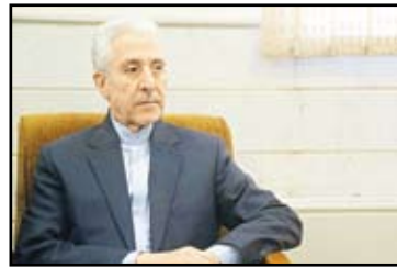
دانشگاه‌های مورد علاقه ثبت‌نام کنند.

به گفته وزیر علوم، ظرفیت پذیرش در کنکور سراسری استاندارد می‌شود.